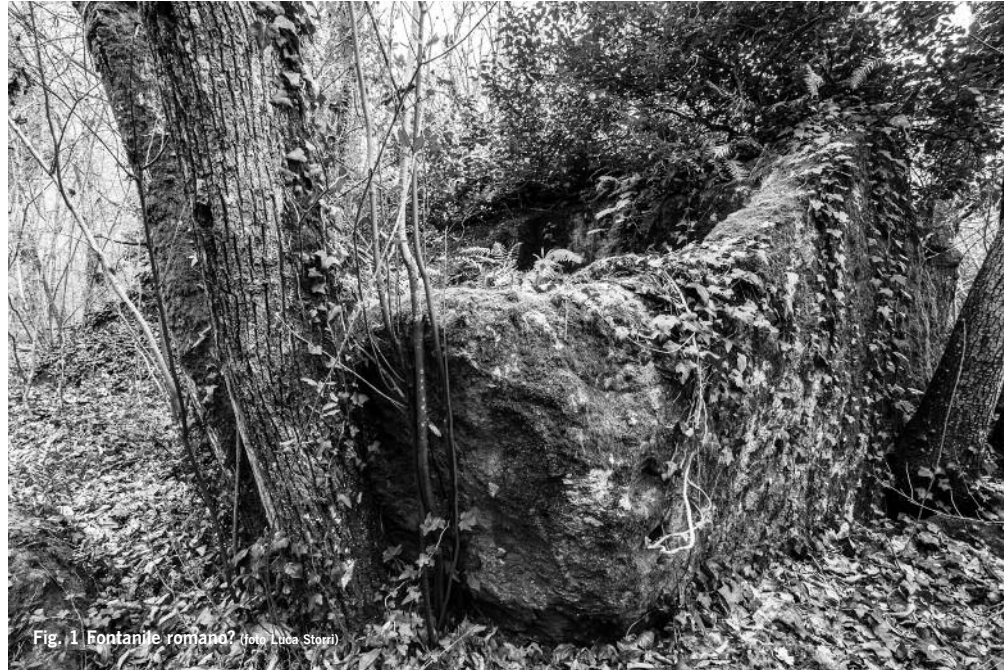
Fig. 1 Fontanile romano?

Tra queste emerge la valle di Cagnemora, accessibile dal cimitero di Bomarzo o dalla località Piano Via Cupa. Scendendo nella profonda valle boscosa contigua al Fosso di Pizzi e alla sorgente di Fontana Salce, superate varie discariche che sfregiano il luogo, si giunge in un ambiente che sembra fatato, particolarmente in primavera quando fiorisce una delicata flora che si fa strada tra le immondizie. Passati questi luoghi di bruttura, il verde prende il sopravvento e subito si incontra una ricca serie di monumenti tipici della zona. Si tratta di varie “pestaròle”, vaschette di decantazio-