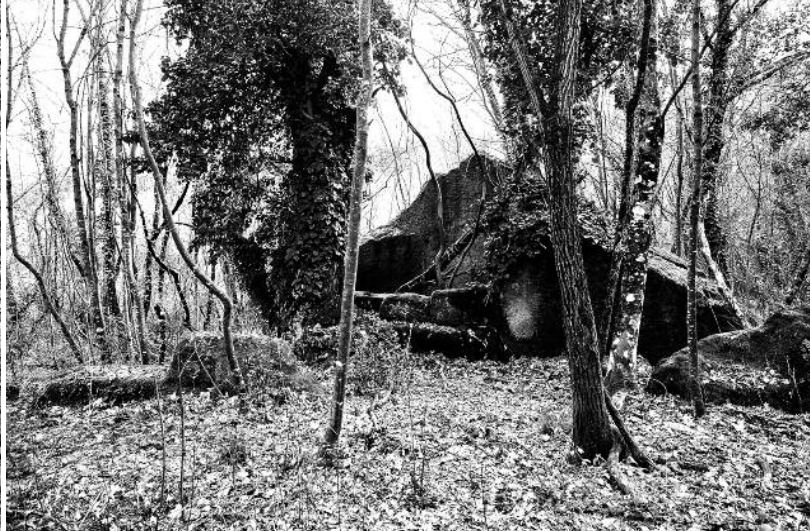
Fig. 4 Struttura riutilizzata

piccole scalette che escludono si tratti di luoghi di cava.