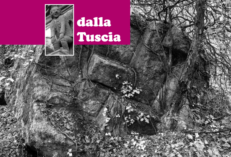
Fig. 3 Masso di cava staccato e rivoltato