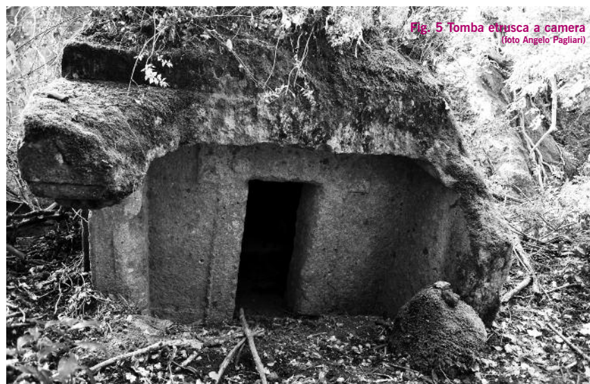
Fig. 5 Tomba etrusca a camera

pupaceci@libero.it salvatorefosci@aruba.it