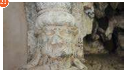
Fig. 23 Il Ninfeo di Cristoforo Madruzzo, dettaglio.

stanza belvedere, nella parte che dà verso il giardino interno, che contiene entrambe le scale di servizio (quella a chiocciola e quella che porta al mezzanino) che snatura la pianta e il prospetto originali anche grazie all'impiego di materiali differenti 48 . A questo periodo vanno poi ricondotte le pitture parietali al piano nobile e del piano superiore - compresi i soffitti a lacunari -, con l'inserimento degli stemmi araldici Albani, pure scolpiti, in tutto l'edificio, anche al suo esterno. Permangono delle decorazioni pregresse (quelle della famiglia Madruzzo) soltanto uno stemma ricavato con i mattoni di cotto giallo chiaro e rossi nel piano di calpestio al grande salone del piano terra e un blasone nella piccola volta all'altezza dell'ingresso al piano nobile (Ludovico Madruzzo 49 ) oltre a qualche traccia, a specchiature marmoree, posta ai lati dell'ingresso del piano terra. A questa committenza si possono inoltre attribuire - oltre tutte le fontane e le statue scampate al saccheggio contemporaneo 50 , ancora disposte nelle loro collocazioni originali - anche uno splendido ninfeo segreto, a tutt'oggi inedito 51 , nascosto da una porta, e attualmente inglobato nelle limitrofe scuderie. Si tratta infatti di un ambiente