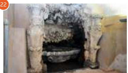
Fig. 22 Ninfeo voluto da Cristoforo Madruzzo e attualmente inglobato nelle scuderie di Palazzo Chigi-Albani, ante 1572.