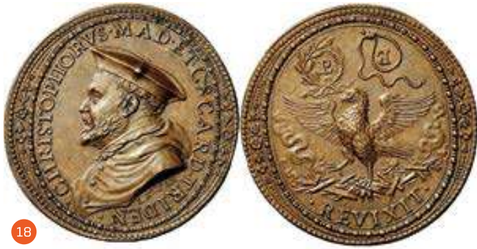
Fig. 18 L. Fragni, medaglia. Bronzo fuso, seconda metà del XVI secolo.